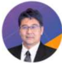
รศ.ดร.รัฐสิทธิ์ สุขะหุต