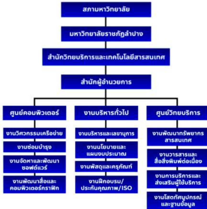
ภาพที่ 1.1 โครงสร้างองค์กรของสำนักวิทยบริการและเทคโนโลยีสารสนเทศ

มหาวิทยาลัยราชภัฏลำปาง ได้แบ่งส่วนราชการในหน่วยงานในระดับกอง และส่วนราชการที่เรียกชื่ออย่างอื่นเทียบเท่าของสำนักวิทยบริการและเทคโนโลยีสารสนเทศ แสดงโครงสร้างองค์กรได้ดังภาพที่ 1.1