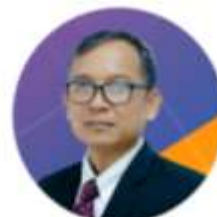
ผศ.ประหยัด ช่วยงาน