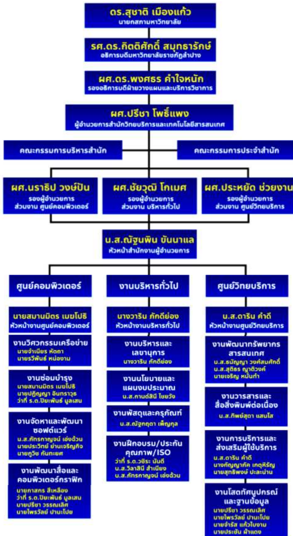
ภาพที่ 1.2 โครงสร้างการบริหารงานของสำนักวิทยบริการและเทคโนโลยีสารสนเทศ